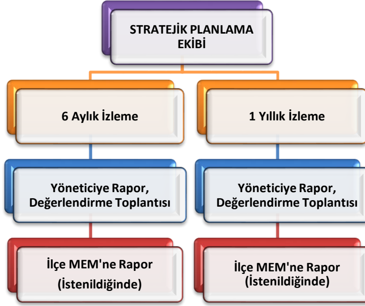
Şekil 2 Stratejik Plan İzleme ve Değerlendirme Modeli

Müdürlüğümüzün 2024-2028 Stratejik Planı İzleme ve Değerlendirme sürecini ifade eden İzleme ve Değerlendirme Modeli hazırlanmıştır. Okulumuzun Stratejik Plan İzleme-Değerlendirme çalışmaları eğitim-öğretim yılı çalışma takvimi de dikkate alınarak 6 aylık ve 1 yıllık sürelerde gerçekleştirilecektir. 6 aylık sürelerde Okul Müdürüne rapor hazırlanacak ve değerlendirme toplantısı düzenlenecektir. İzleme-değerlendirme raporu, istenildiğinde İlçe Milli Eğitim Müdürlüğüne gönderilecektir.